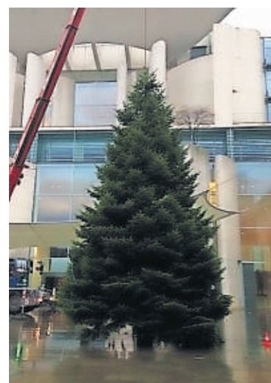
Die 15 Meter hohe Nordmantanne vom Hof Oelkers wird vor dem Bundeskanzleramt aufgestellt.