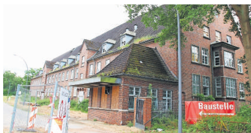
Das zweite bleibende Kasernengebäude mit dem früheren Wachhäuschen wird im zweiten Bauabschnitt umgebaut und Pflegeappartements, eine Tagespflege und ein Thermalbad bieten.