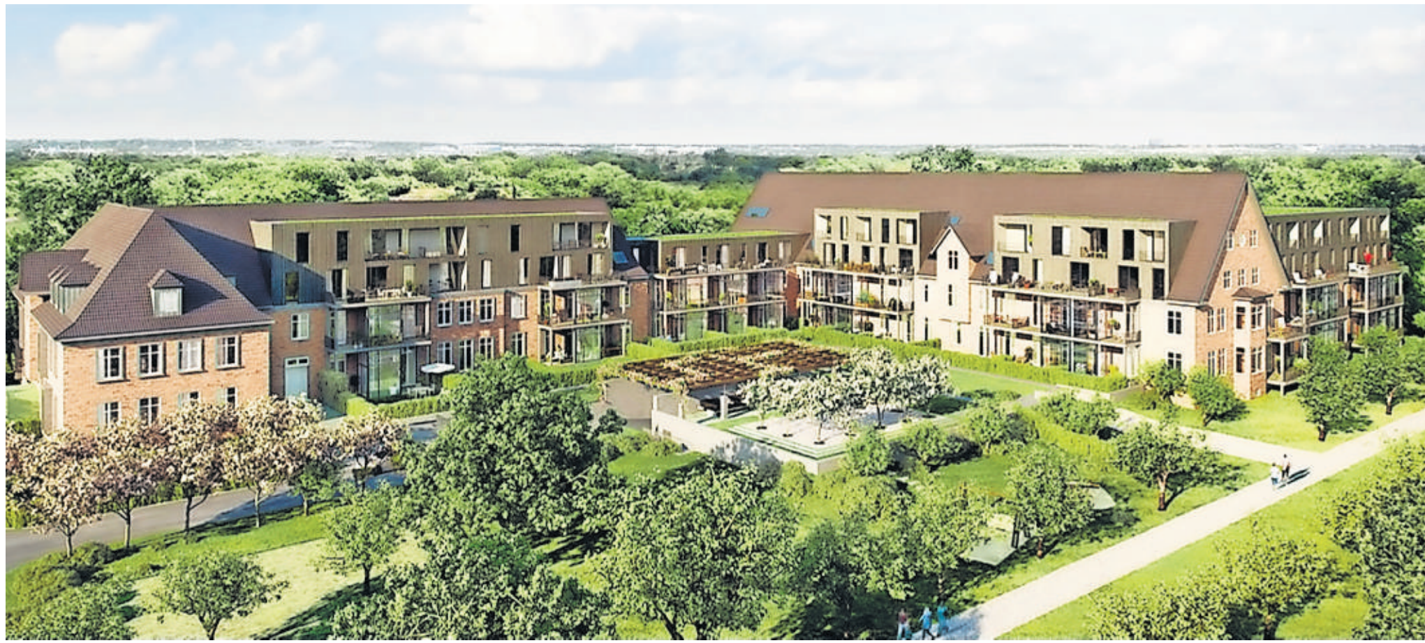
So wird der erste Bauabschnitt der „Fischbeker Höfe“ aussehen: Das bestehende Kasernengebäude wird architektonisch aufgehübscht und zu Seniorenwohnungen mit Balkons umgebaut. Im Kopfgebäude (links im Bild) wird eine Kindertagesstätte untergebracht. Visualisierung DeepGreen Development